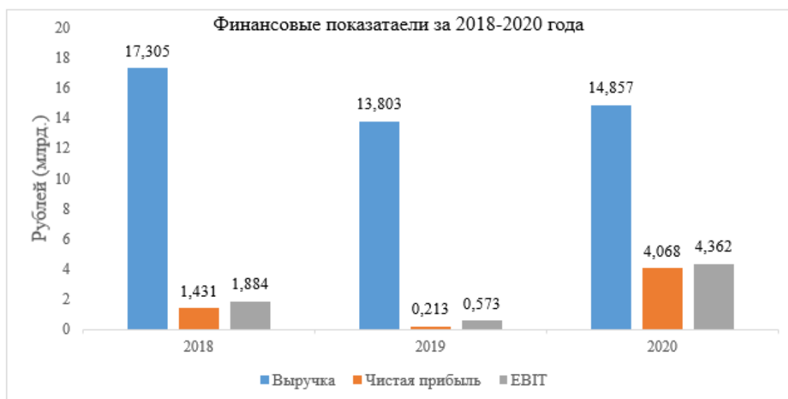
Рисунок 3 – Финансовые показатели ООО «Агрофирма Ариант» за 2018–2020 года